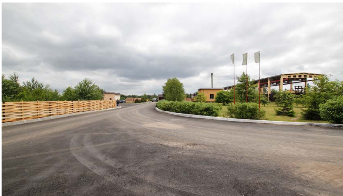
Въезд на территорию Дивинского цеха переработки древесины