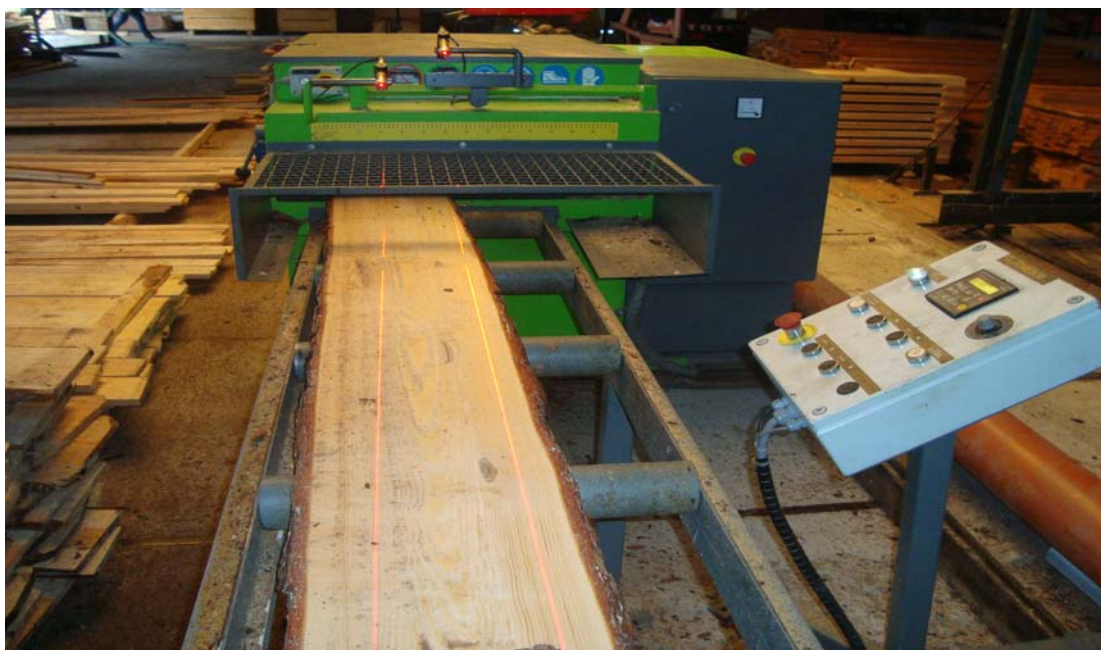
Многопильно–круглопильный станок MEBOR VR 800 с лазерным наведением