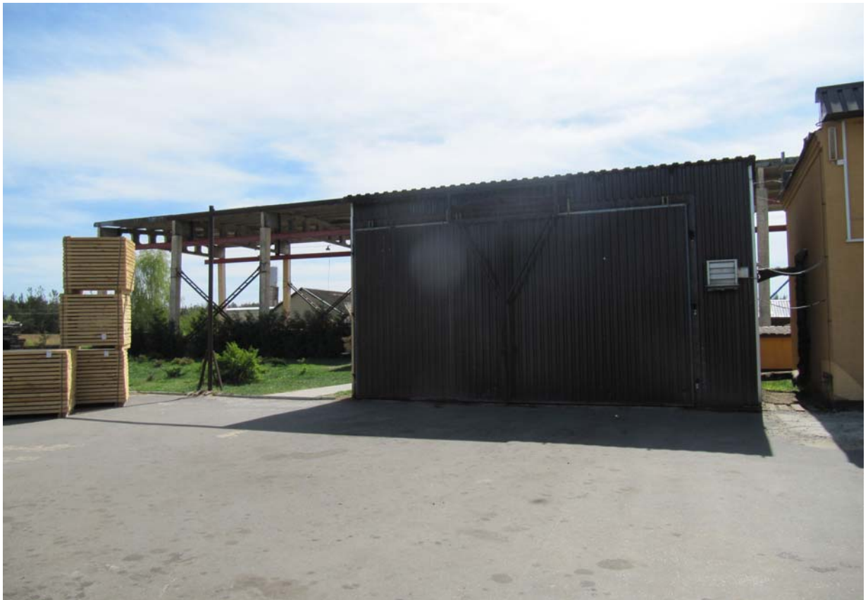
Сушильный комплекс Дивинского ЦПД