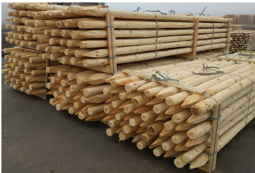
Колья деревянные окоренные Длина: от 1,5 м до 5,0м Диаметр: 5-12 см