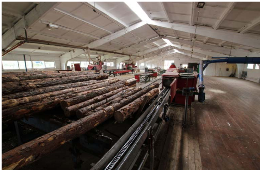
Тарный цех Дивинского ЦПД